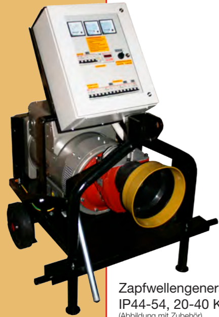
Zapfwellengenerator IP44-54, 20-40 KVA (Abbildung mit Zubehör)