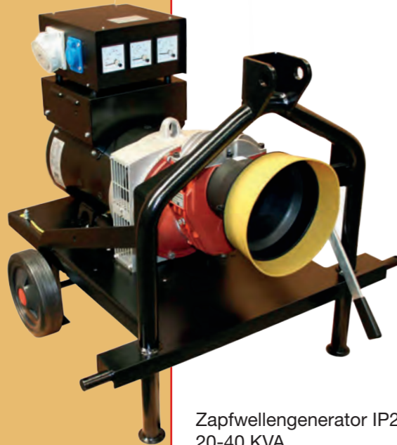
Zapfwellengenerator IP23 20-40 KVA